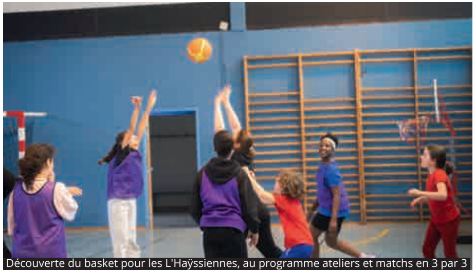
Découverte du basket pour les L'Hayssiennes, au programme ateliers et matchs en 3 par 3

Pendant tout le mois de mars, les L'Hayssiennes ont pu bénéficier d'une programmation inédite rien que pour elles. Les différents services de la Ville, en partenariat avec le tissu associatif local, se sont mobilisés pour offrir des activités sur-mesure, pour un mois haut en couleur. Avec de nombreux rendez-vous culturels, comme l'exposition photo « Portraits de femmes » d'Angélique Krouri, lauréate de la Bourse initiative jeune, mettant en avant diverses L'Hayssiennes talentueuses.