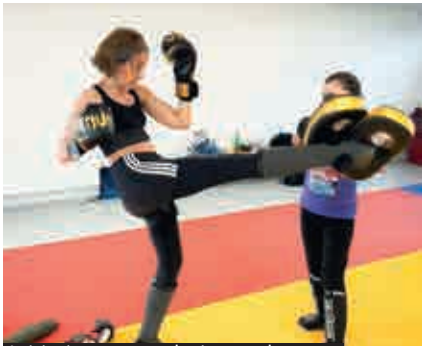
Initiation aux techniques des arts martiaux variés avec le CAL Arts Martiaux