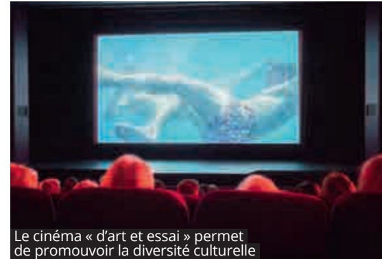
Le cinéma «d'art et essai» permet de promouvoir la diversité culturelle

L'initiation à la culture cinématographique se poursuit à l'école. Les écoliers L'Haÿssiens assistent à des projections régulières, parfois accompagnées d'ate-