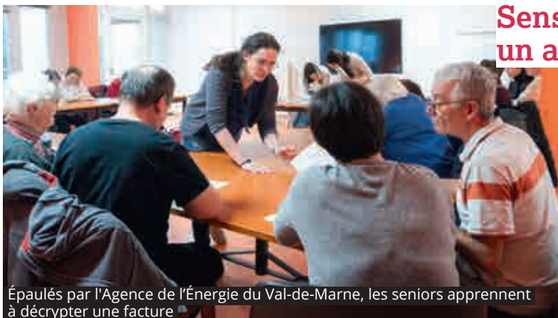
Épaulés par l'Agence de l'Énergie du Val-de-Marne, les seniors apprennent à décrypter une facture