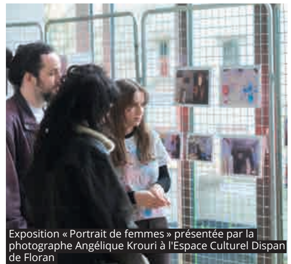
Exposition « Portrait de femmes » présentée par la photographe Angélique Krouri à l'Espace Culturel Dispan de Floran